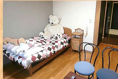
※家具等は配置されていません。