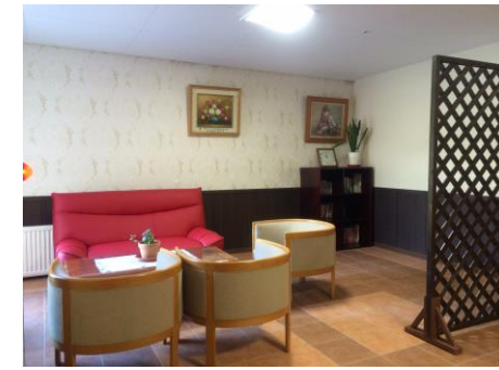
▲エレベータホール