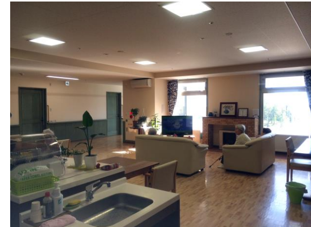
▲キッチンとリビング

▲ユニット玄関 キッチンでは入居された方とスタッフが一緒に炊飯し、リビングなどでお食事を召し上がっていただいております。また、リビングはパブリックスペースとして入居者同士が気軽に集える場所となっております。