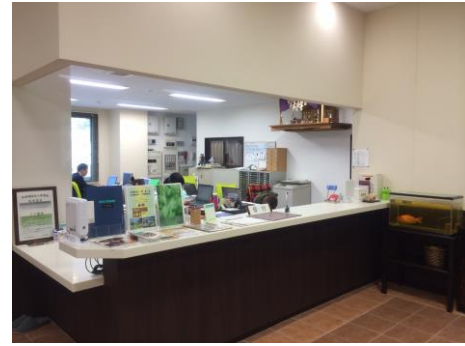
▲事務所カウンター