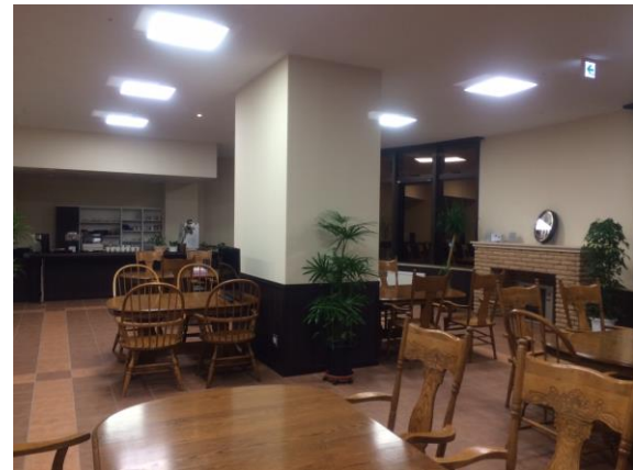
▲地域交流スペース