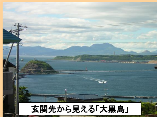
玄関先から見える「大黒島」