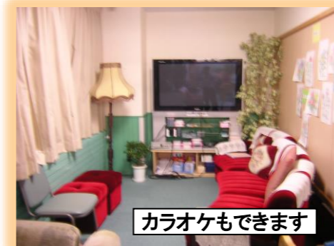
カラオケもできます