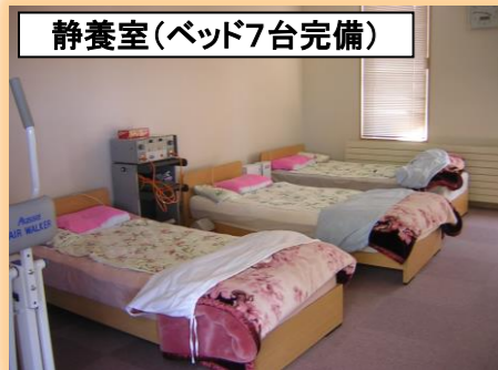
静養室(ベッド7台完備)