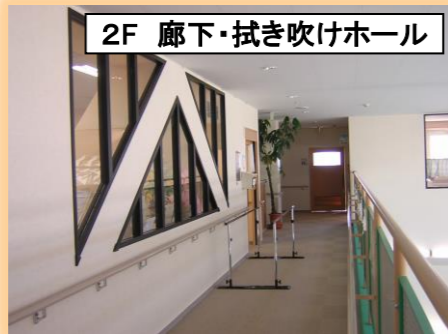
2F 廊下・拭き吹けホール