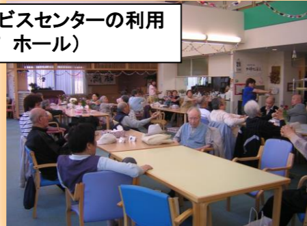
デイサービスセンターの利用 風景(1F ホール)