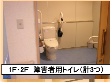
1F・2F 障害者用トイレ(計3つ)