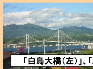
「白鳥大橋(左)」、「駒ヶ岳(右)」が一望できる