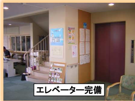
エレベーター完備