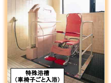
特殊浴槽 (車椅子ごと入浴)