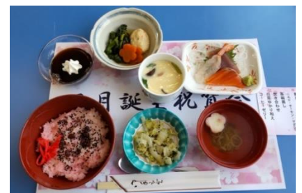
お誕生日メニュー