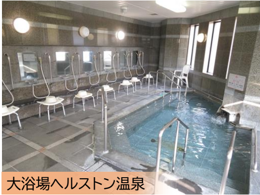
大浴場ヘルストン温泉