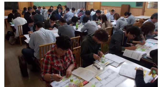
28.6.15 ひもときシート指導者養成研修