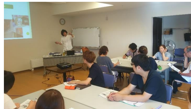
28.8.8 ユニットケア専門研修会