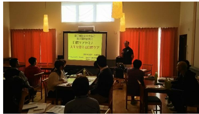
28.3.31 平成28年度入社職員研修