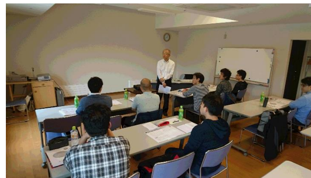
28.7.6-7 介護スタッフ実践力向上研修（初級）