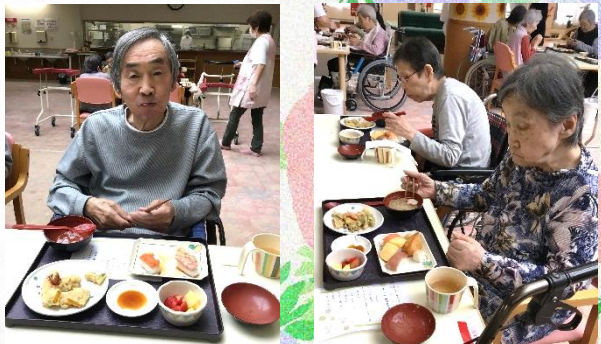
裏面にも記事載っています!

湘南は今年で開設29周年を迎えました。そこで、5月24日(金)に開設記念昼食会を開催し、お寿司や天ぷらなどが皆さんに振舞われました。お寿司はおかわり自由で、皆さん沢山召し上がっていました。