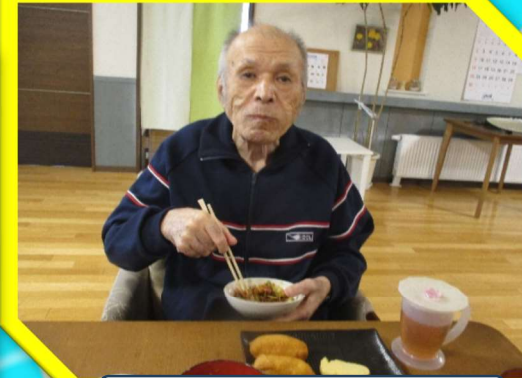
焼きそばも美味しい♪