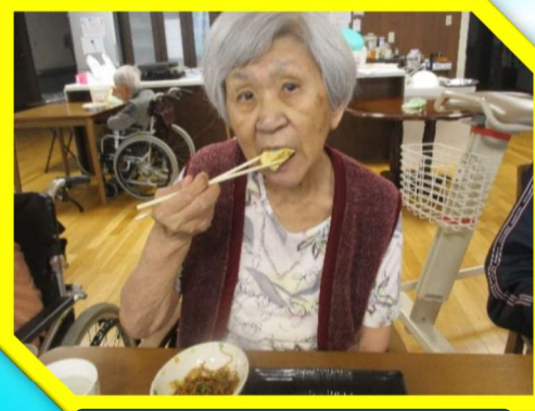
まずは卵焼きから♪