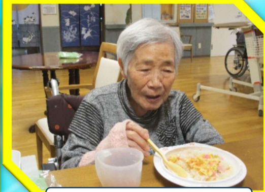
ちらし寿司も良いよ♪