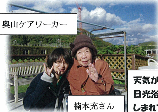
奥山ケアワーカー