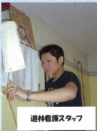
道林看護スタッフ