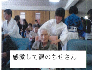
感激して涙のちせさん