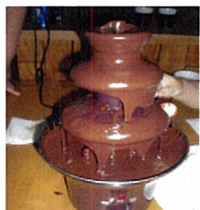
これがすずらんのチョコレートファウンテンです。