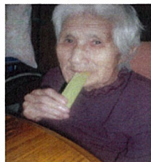
おいしそうですね