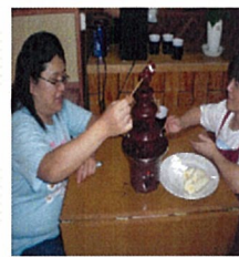
ついでにスタッフも(笑)