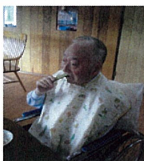
吉野さんも満足そう。