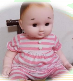
命名：すみれちゃん

皆さん「かわいいね。」と話され、撫でたり、抱っこされています。穏やかな表情をされ、懐かしいね。と話されています。