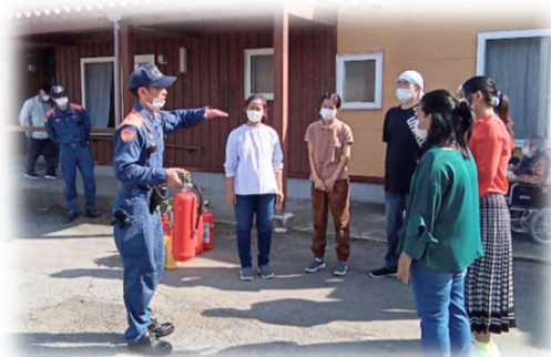
総合避難訓練の様子。消防職員からの指導

GHぬく杜の郷しおさいでは、地域密着施設として豊浦町内の様々な関係機関と密に連携を図っています。社会福祉協議会の運動会や医療機関での感染研修、消防職員から火災避難訓練の指導など、入居者の皆様が、『長年住み続けてきた町で安心して暮らし続けられる』よう取り組んでいます。「あれ！おばさん元気だね！変わらないね！」という地域の方との会話がとても微笑ましいです。