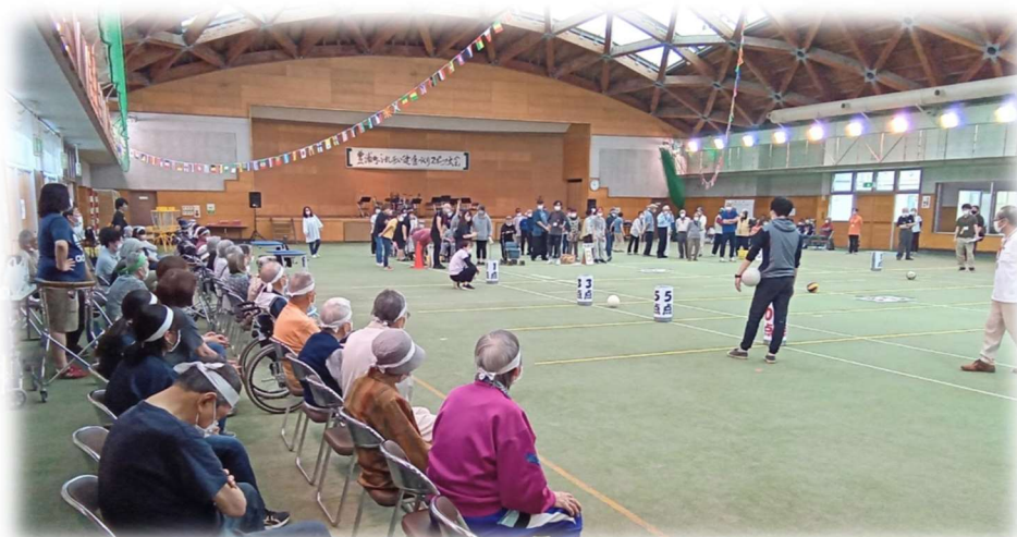
豊浦町ふれあい健康スポーツ大会へ参加