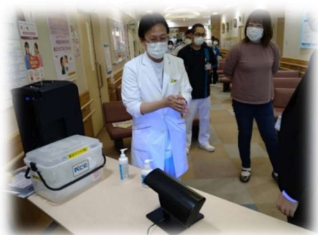
豊浦国保病院の感染研修へ参加