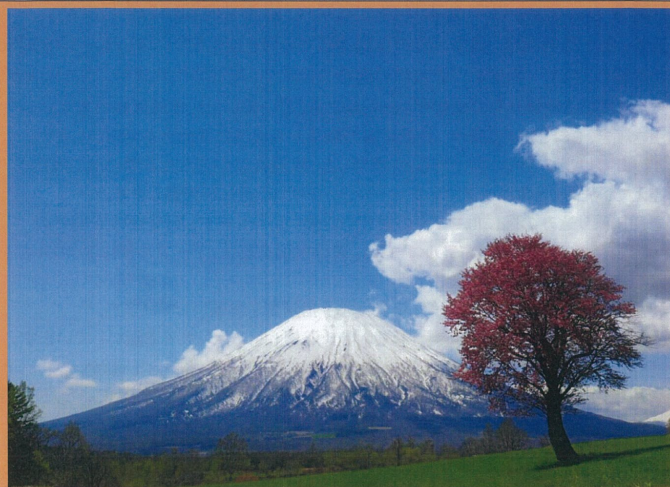
一本桜と蝦夷富士:京極町