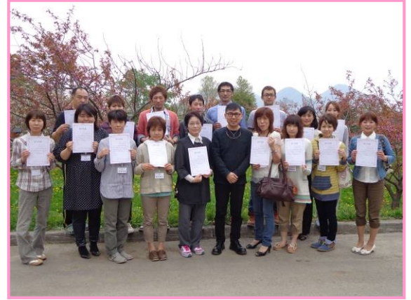
第1回認知症対応型サービス事業 管理者研修修了者