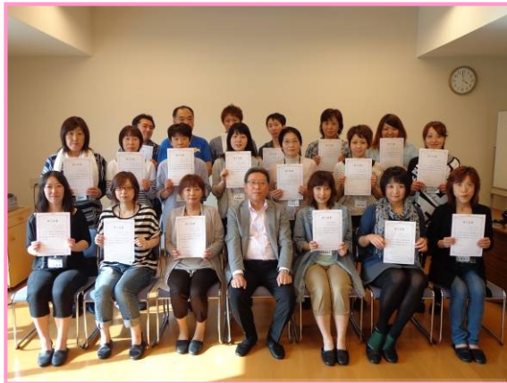
第1回認知症介護実践者研修 修了者

会 場 地域密着型特別養護老人ホーム財田の杜 (虻田郡洞爺湖町川東 80-16)