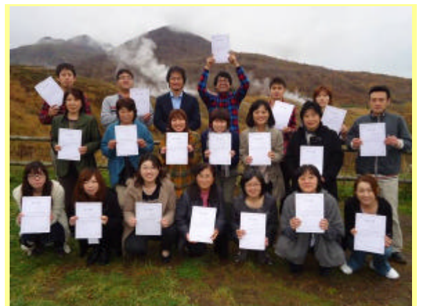
第 2 回修了者