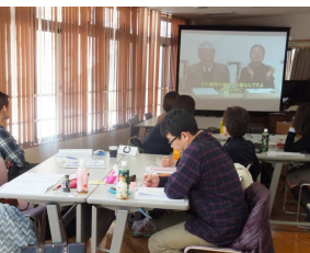
管理者研修受講風景