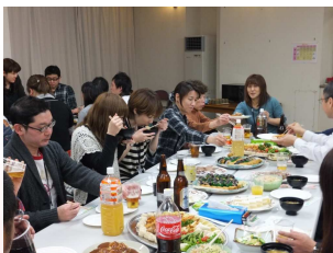
実践者研修交流会