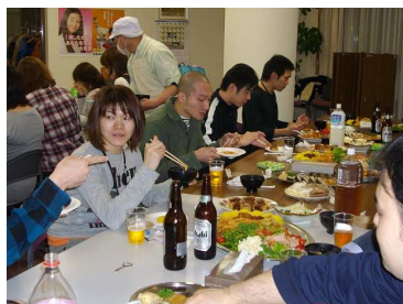
交流会の様子(研修初日)

実践者研修においては、初めて道外(広島県)から受講者を向かえ、すっかり冬の装いとなった研修センター(洞爺湖)で実施されました。1月18日に実践者研修の実習報告会が行われ、修了証書が交付されました。