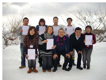
管理者研修修了者