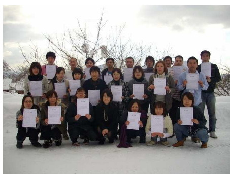
実践者研修修了者